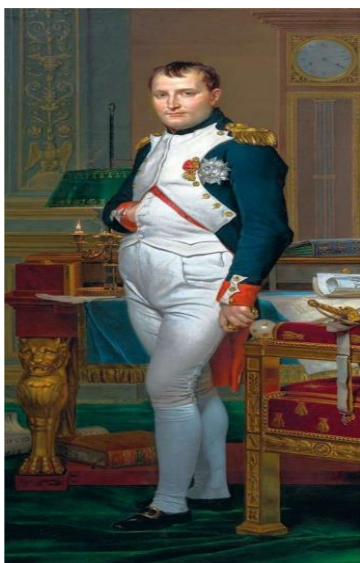
Napoléon Bonaparte (1769-1821)

Fin Temps modernes et début Epoque contemporaine