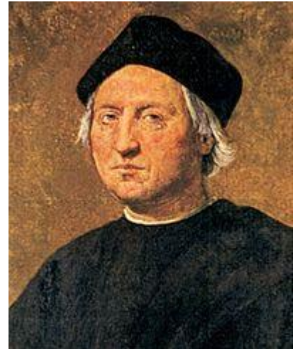
Christophe Colomb (1451-1506)