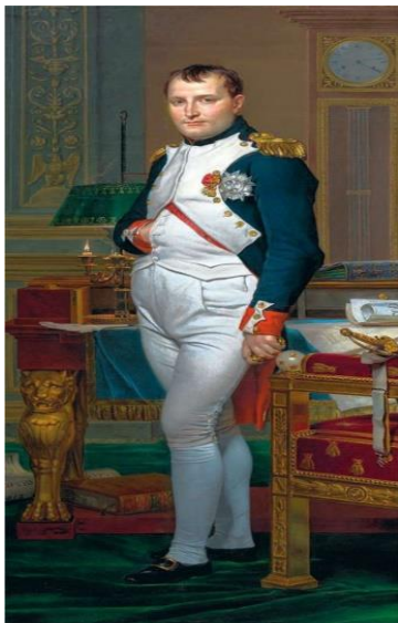
Napoléon Bonaparte (1769-1821)