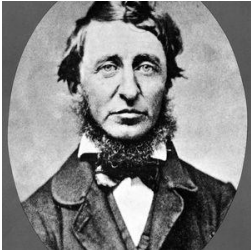
Henry David Thoreau