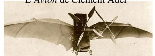
L'Avion de Clément Ader

Le 17 décembre 1903, Orville et Wilbur Wright, deux frères américains, effectuent le premier vol motorisé et dirigé à bord du Flyer . C'est un biplan qui possède une innovation importante : un gouvernail qui permet de contrôler la trajectoire. Il est entraîné par 2 hélices reliées par des chaînes à un moteur à essence.