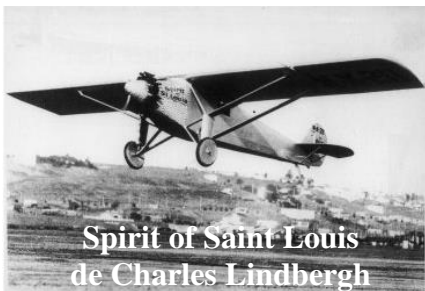
Spirit of Saint Louis de Charles Lindbergh

Le 3 juillet 1909, lors d'un meeting aérien, Louis Blériot vole pendant plus de 1 heure avec son monoplane. Le 25 juillet 1909, il effectue la première traversée entre Calais et Douvres en 37 minutes, en volant jusqu'à 100 m au-dessus de la Manche.